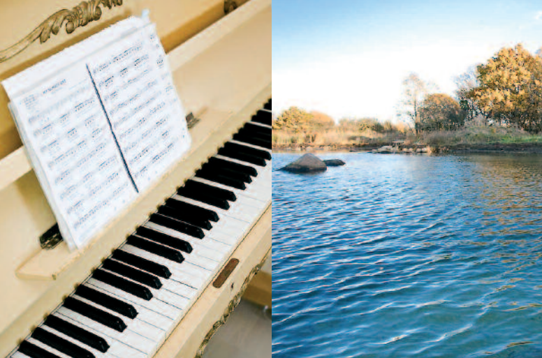
KasperSol ligger i Eriksöre på Öland. Hav och vacker natur möts i det underbara landskapet.